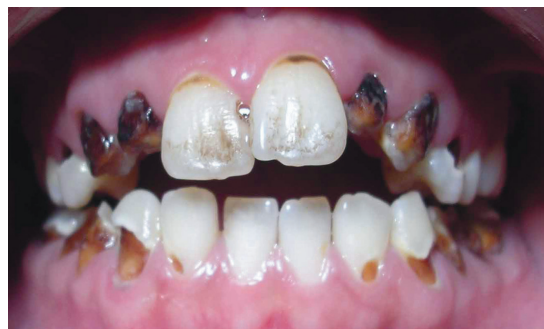
Dit is een abnormaal slecht verzorgd gebit met vergevorderde cariës

Gaatjes (ook wel cariës of tandbederf genoemd) worden veroorzaakt door bacteriën die leven in je gebit. Ze leven van achtergebleven restjes eten dat op en tussen je tanden zit. De bacteriën zetten de suikers uit het eten om in zuur en dit zuur breekt je tandglazuur af waardoor er een gaatje kan ontstaan. De bacteriën die gaatjes veroorzaken bevinden zich overal in de mond. Iedereen heeft deze bacteriën in zijn mond, in meer of mindere mate. Deze cariës veroorzakende bacteriën bevinden zich in tandplaque.