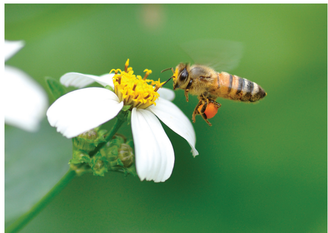
De honingbij haalt nectar en stuifmeel uit bloemen. Op deze foto is goed te zien hoe het stuifmeel in klompjes op de poten wordt verzameld.

Leven in groepen biedt voor veel dieren een voordeel ten opzichte van een solitair bestaan. Daarom zijn er veel dieren die in groepen leven. Zo bieden groepsgenoten elkaar bijvoorbeeld bescherming. Voor een luipaard is het bijvoorbeeld erg lastig één zebra te pakken als hij een hele kudde vol met strepen ziet. Voor dolfinen is het eveneens lastiger om één visje uit een hele school vissen te plukken. De buitenste dieren hebben meer kans om gepakt te worden, maar alle dieren in het midden zijn veiliggesteld. Ook levert het een