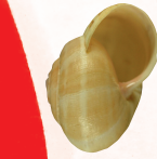
Zandslak ( Theba pisana )