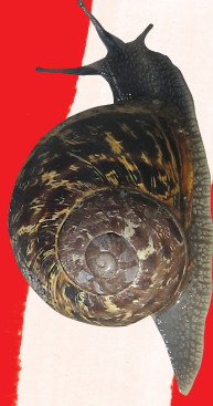
Segrijnslak ( Cornu aspersum )