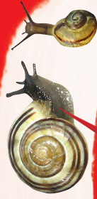
Juvenile vormen van Cepaea