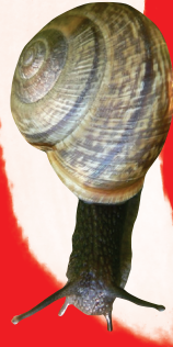
Heesterslak ( Arianta arbustorum )