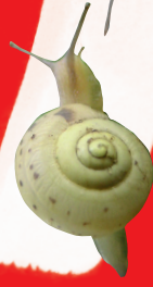
Struikslak ( Fruticicola fruticum )