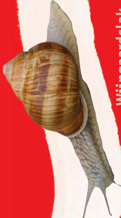
Wijngaardslak ( Helix pomiana )